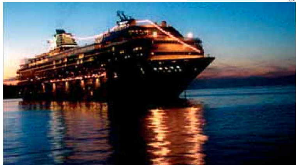
O paquete, com 201 metros, partiu da Grécia no início do mês, sendo Lisboa o primeiro porto onde irá parar

São centenas os estudantes, de licenciaturas e pós-graduações, que aprofundam aqui os seus conhecimentos, com aulas em várias universidades. Durante a sua estadia em Lisboa, farão visitas de estudo no terreno para conhecerem